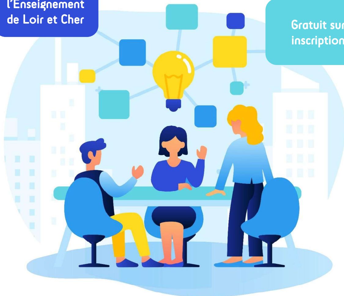
Illustration par TanahAir Studio