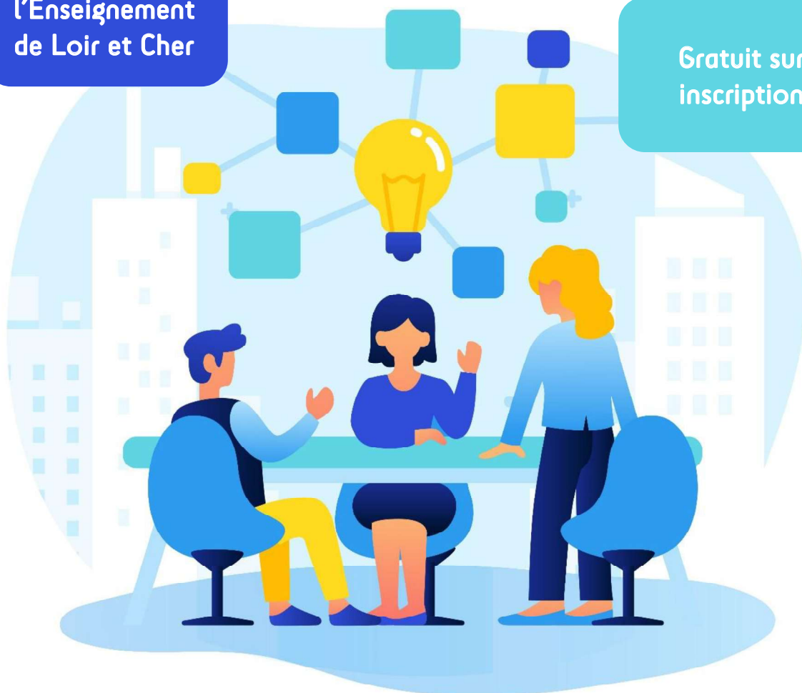
Illustration par TanahAir Studio